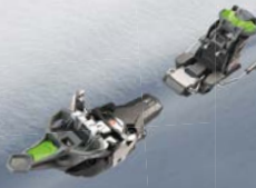
Fritschi VIPEC EVO die Multifunktionale