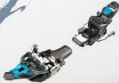
Fritschi TECTON die Stabile