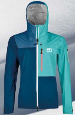
Ortovox 3L Ortler Jacket W