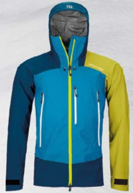
Ortovox Westalpen 3L Jacket M