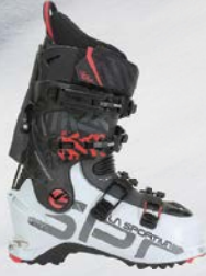
La Sportiva Vega Woman