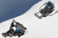
Fritschi XENIC die Leichte