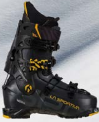
La Sportiva Vega Man