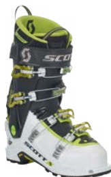
Scott Cosmos III CHF 479.-