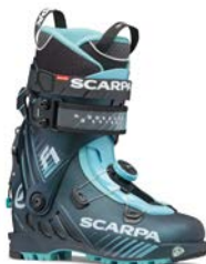
Scarpa F1 / Women CHF 615.-