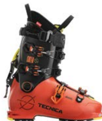
Tecnica Zero G Tour Pro CHF 639.-