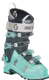
Scott Celest / Women CHF 479.-

OFFIZIELLER AUSTRÜSTER DES SKICLUB HOMBERG